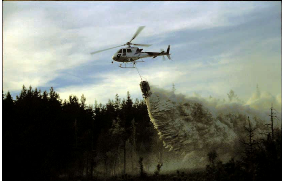
Figur 1. Utan en väl utbyggd kalkningsverksamhet hade många sjöar och vattendrag varit försurade i Jönköpings län. Helikopteralkning är en effektiv metod. (Foto Tobias Haag).

doserarna, vars syfte var att kalka både sjöar och vattendrag kom 1981 i Gislaveds och 1984 i Vetlanda kommun. Våtmarkskalkningen som är till för både sjöar och vattendrag startade 1985 i exempelvis Brusaåns källflöden i Eksjö kommun. Fullt utbyggd var kalkningsverksamheten i slutet av åttiotalet och har i stort sett haft samma omfattning sedan dess. Denna verksamhet har idag kommit att bli en mycket värdefull och välbehövad del av den aktiva naturvården i länet (figur 1).