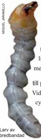
Larv av bredbandad ekbarkbock.

Den bredbandade ekbarkbocken ( Plagionotus detritus ) lägger ägg i barken på nyligen döda grövre stam- och grendelar av ek. Äggen läggs förmodligen ett och ett i barkspringor från mitten av juni till början av juli.