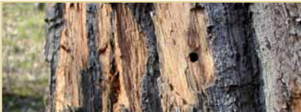
Kläckhål i ekens bark. Kläckhålen är cirka sex millimeter stora. Notera att hackspettar försökt att flaga barken i jakt på larverna inne i trädet.