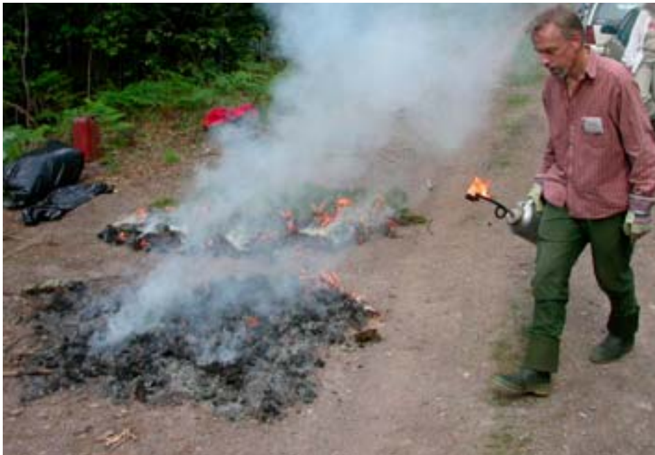
Vid utbildning i naturvårdsbränning studeras hur branden betar sig, bl.a. beroende på vindriktningen och finbränslets fukthalt.

Utbildningar för bränning i naturreservat är viktiga och kortare kurser anordnas av Naturvårdsverket i samarbete med Skogsstyrelsen och länsstyrelserna m.fl. (För kursplaner hänvisas till kursmaterial från Kalmar, augusti 2004 och Ånge, maj 2005) En mer praktisk utbildning av bränningsledare bör i förekommande fall ske i samarbete med erfarna bränningsentreprenörer. Det viktigaste för Länsstyrelserna, som oftast är förvaltare av naturreservat, är att ha en adekvat beställarkompetens. Andra typer av utbildning kan röra brandekologi, brandhistoria och information.