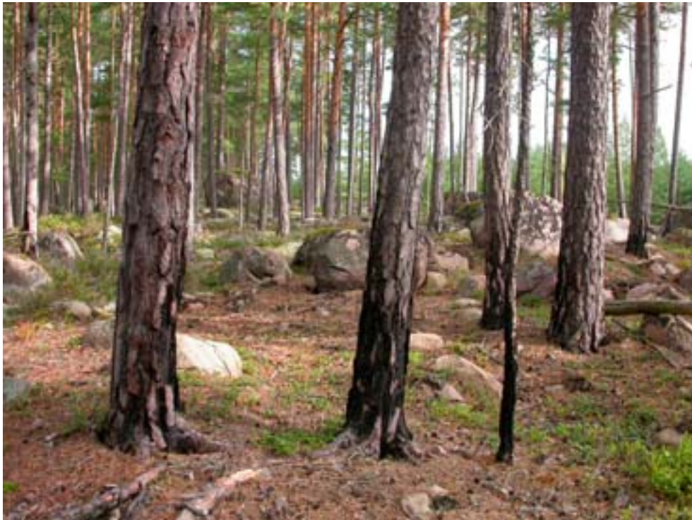
Nyligen spontan brunnen tallskog i Hornsö, Kalmar län. En av de viktigaste värdeattraktionerna för brand och vedlevande insekter i sydöstra Sverige. Foto: Magnus Nilsson, 2004.

Det har även brunnit på många håll i södra Sverige. Intressanta regioner finns t.ex. i nordvästra Götaland, hela Svealand och inte minst i östra Götaland. Statistik visar att det finns synnerligen brandbenägna regioner i Kalmar- och Östergötlands län. Blixten tänds eld på skogen fyra gånger så ofta här som i norra Sverige. Det är också främst i den torra sydöstra delen av Sverige som de verkligt brandberoende växterna, t.ex. brandnäva och svedjenäva har sin starkaste utbredning i Sverige. Kunskapen om bränders och brandberoende arters utbredning behöver i många fall förbättras, för att kunna prioritera och koncentrera insatserna. Tallhedar på sedimentmark t.ex. är ovanligare och bör särskilt prioriteras.