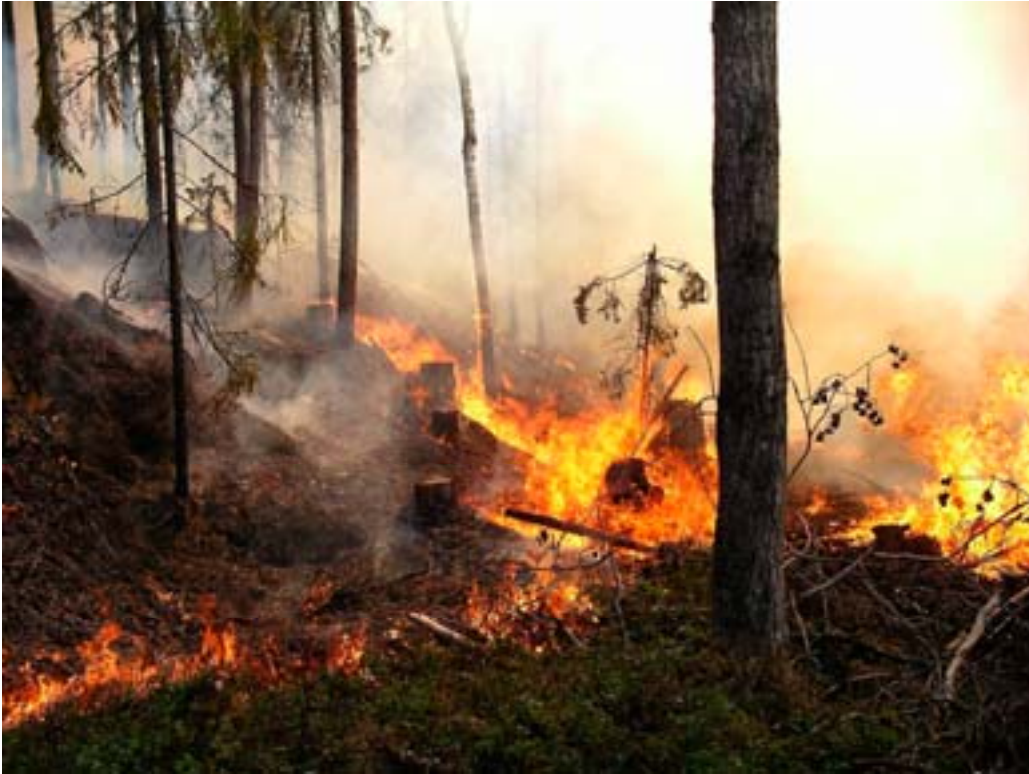
Naturvårdsbränning i Tunvågen, Jämtland län, 2004.