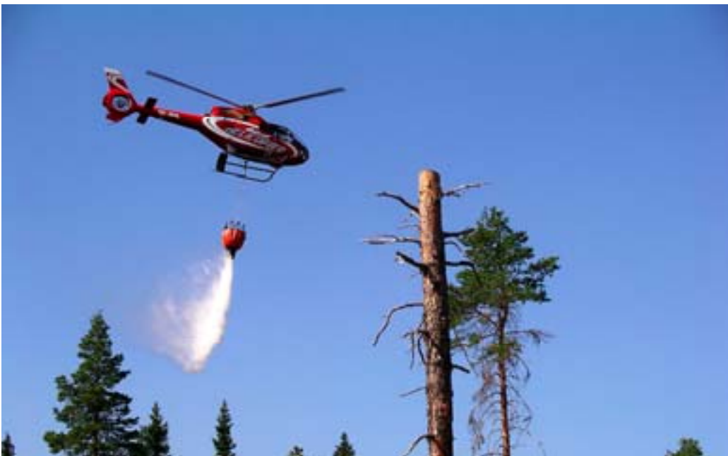
Brandsläckning från helikopter Tunvägen i Jämtland 2004.

Det är viktigt att dokumentera och redovisa när en räddningsinsats påbörjas och avslutas, vilket beslutas av den som leder insatsen, d.v.s. räddningsledaren. Räddningsledarens beslut om när en räddningsinsats ska avslutas kan inte överklagas. Räddningschefen, eller den som av räddningschefen utsetts till räddningsledare, har dessutom en skyldighet att informera fastighetsägare eller nyttjanderättsinnehavare om att insatsen är avslutad och om behovet av bevakning mm.