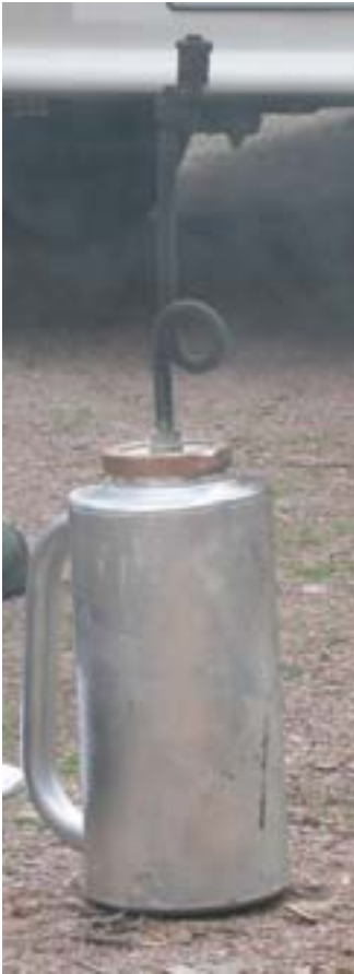
Tändkanna. Foto: Magnus Nilsson 2004.