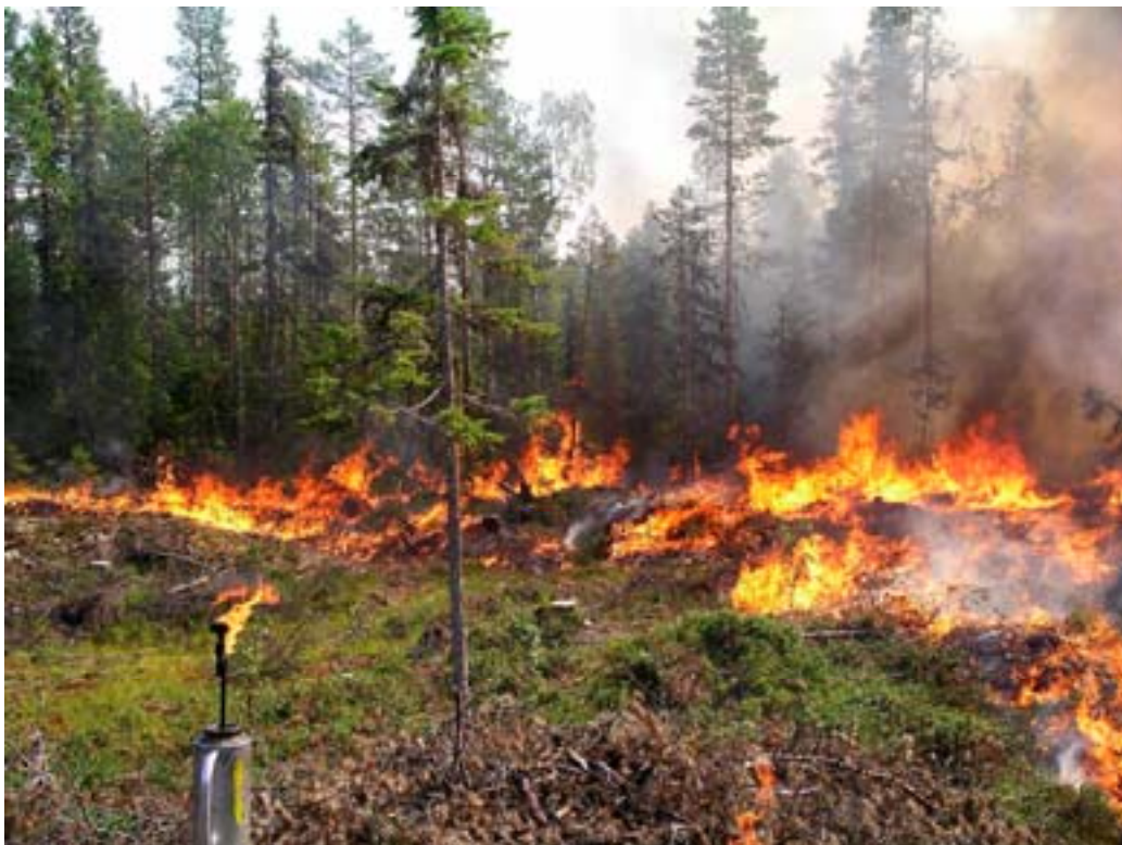
Naturvårdsbränning 2004 i Tunvågen, Jämtlands län.

Branden har en viktig roll i de tre sistnämnda fallen, inte minst för det s.k. långsiktiga skyddsmålet. Enligt Miljövårdsberedningen (1997) har elden en viktig roll i restaureringsarbetet.