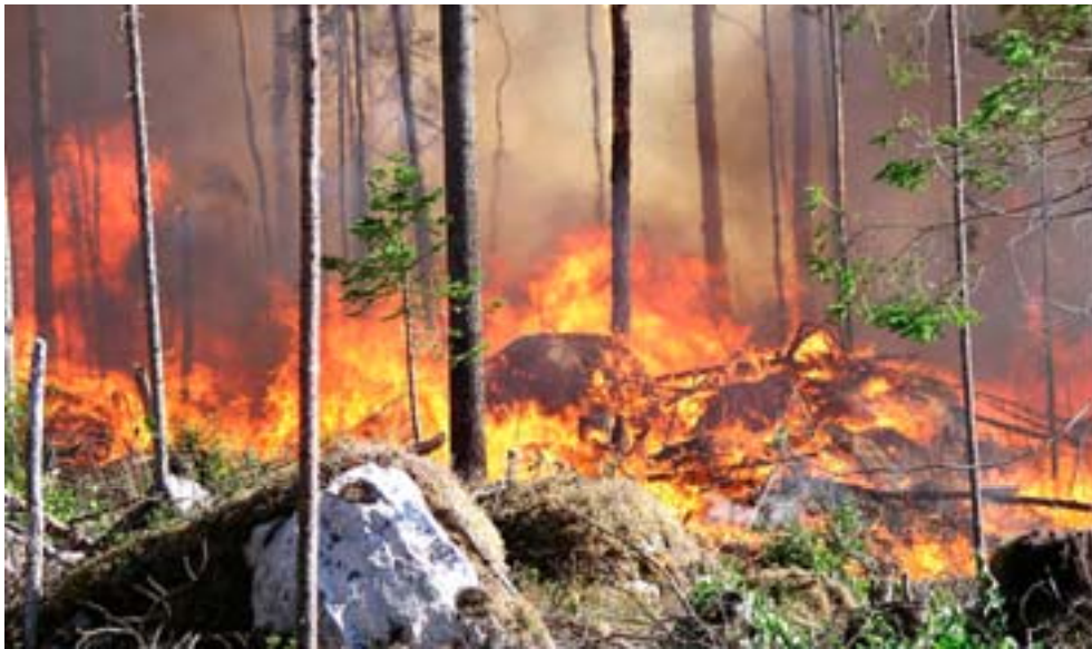
Naturvårdsbränning i Tunvågen 2004, Jämtlands län.

Eftersom varje enskild brand påverkar skogen på olika sätt, uppstår en mosaik av skogstyper och trädslag. I denna mosaik ingår även s.k. topografiskt betingade brandrefugier som sällan brinner. De utgörs ofta av fuktiga partier med t.ex. gran-sumpskog eller lövskogsbevuxna kärr. Här trivs arter som kräver hög luftfuktighet och stabilt beståndsklimat. Brand i mosaikartade områden kan innebära att branden naturligt får en varierad utveckling som resulterar i en ökad artdiversitet.