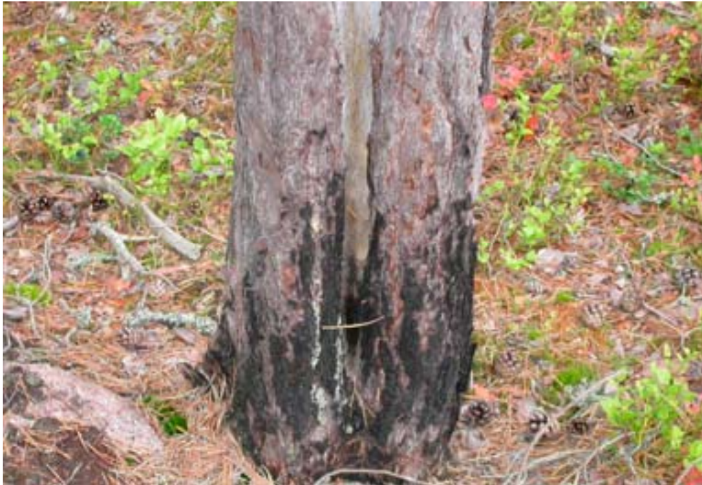
En tall med äldre brandljud (>80 år) har på nytt brandskadats av en lågintensiv brand. Skadan indikeras av kådflödet intill det gamla brandljudet. Foto: Magnus Nilsson, 2004.

Tallar som överlever brand kan skapa s.k. brandljud på stammen. På trädets läsida där lågorna/bränngaserna stannar längre tid genom virvelbildning kan en partiell kambiedöd inträffa. Flera år senare faller barken av, varvid veden exponeras och ett s.k. brandljud (brandlyra) bildas. Tallen bildar under läkningsprocessen rikligt med kåda, i och omkring skadestället, och vullar med tiden över skadan med ny bark.