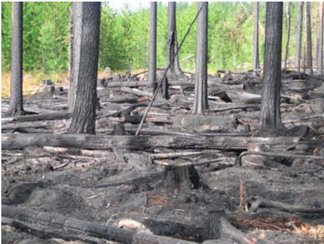
Nyligen bränd tallskog i Stormyrån, Västernorrlands län 2004.

Första tiden efter en brand kan det dock finnas påtagliga risker att vistas i området. I extremfall som efter Tyrestabranden kan många träd stå ostadigt och vissa risker kan kvarstå en längre tid. Det kan även vara svårframkomligt p.g.a. nedfallna träd och håligheter. Efter en naturvårdsbränning kan det vara önskvärt att stängsla in området för att undvika viltbete, vilket kan innebära en inskränkning i rörelsefriheten, men det kan enkelt lösas med övergångar. Det kan finnas naturreservat där motsättningar med friluftsliv, som missgynnas av en brand, förekommer. I dessa fall får man göra en noggrann avvägning och prioritering. Om det finns sådana motsättningar där man bränner är det extra viktigt med en informations-satsning.