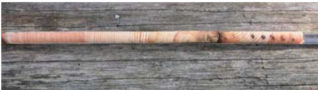
Borrkärna från tall som brandskadats redan som ungt träd. Hornsö, Kalmar län.

Tallar som överlever brand kan skapa s.k. brandljud på stammen. På trädets läsida där lågorna/bränngaserna stannar längre tid genom virvelbildning kan en partiell kambiedöd inträffa. Flera år senare faller barken av, varvid veden exponeras och ett s.k. brandljud (brandlyra) bildas. Tallen bildar under läkningsprocessen rikligt med kåda, i och omkring skadestället, och vullar med tiden över skadan med ny bark.