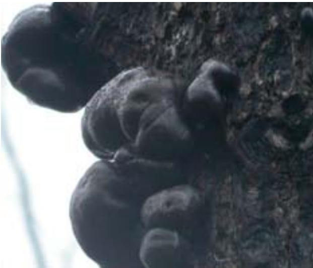
Brandskiktdyna i Hornsö, Kalmar län 2004.

Andra svampar växer på bränd ved, dels på stammarna som brandskiktdyna (på bränd björk), dels på skadade trädrötter som rotmurkla. Efter brand kan också slemsvampar (myxomyceter, t.ex. trollsmör), uppträda i explosionsartat stor mängd på brända stammar. Dessa lever på bakteriefloran som frodas i trädens savflöden efter brandskadorna. Både brandskiktdynan och trollsmör är sedan i sig livsmiljöer för många sällsynta insekter. Det finns också skäl att tro att ett flertal vedsvampar med speciella krav på den döda tallens kvalitet inte dyker upp förrän vissa äldre tallar, som utsatts för ett flertal bränder faller.