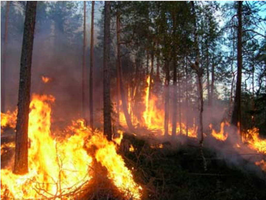
Naturvårdsbränning i Stormyran, Västernorrlands län, 2004.