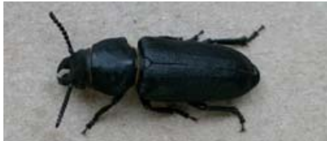
Bitcock, ett exempel på en av hundratals vedskalbaggar som gynnas av brand. Foto: Magnus Nilsson, 2004

Ett 40-tal insektsarter i Sverige, bl.a. skalbaggar, skinnbaggar, flugor och fjärilar är idag kända som direkt brandberoende. Ytterligare 100-tals är dessutom gynnade av brand. De har olika anpassningar till rök, värme och eld och de flesta av de brandberoende insekterna kräver bränd skog. De utvecklas i ihjälbrända träd (ex. sotsvart praktbagge - Melanophila acuminata ) eller bränd mark (ex. brandlöpare - Sericoda quadripunctata ). Sandblottor gynnar många steklar. Brandinsekter är konkurrenssvaga och nybränd skog erbjuder därför en lämplig miljö att kolonisera. Bränning av ett hygge med kvarlämnade träd är ett alternativ, men då det normalt dröjer ett par år mellan avverkning och bränning har de brandgynnade insekterna redan fått stark konkurrens från andra insekter. Insekterna är mobila och en del kan flyga långt, men det är ändå viktigt med brandkontinuitet i en trakt för de mer krävande arterna. Individrikedomen på ett brandfält är störst de första åren efter en brand, och klingar sedan av.