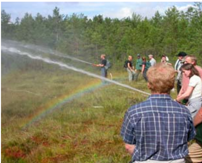
Utbildning i naturvårdsbränning kan även innehålla övningar i släckning. Kalmar 2004.

Vid bränning bör det finnas etablerade samverkansrutiner och en dialog mellan berörda parter, som den kommunala räddningstjänsten, kommunernas miljöförvaltningar, länsstyrelsernas räddningstjänstexperter etc. Dialogen kan gälla vilka regler som gäller vid eventuella eldningsförbud samt skälen och motiven för olika naturvårdsåtgärder som berör bränder i skog. Dessutom bör respektive part känna till ansvar och rutiner om bränningar genomförs. Ett lämpligt sätt kan vara att räddningstjänsterna och naturvårdsmyndigheter m.fl. utbyter kunskap kring brandekologi, naturvårdsbränning, brandbekämpning och lagstiftning m.m.