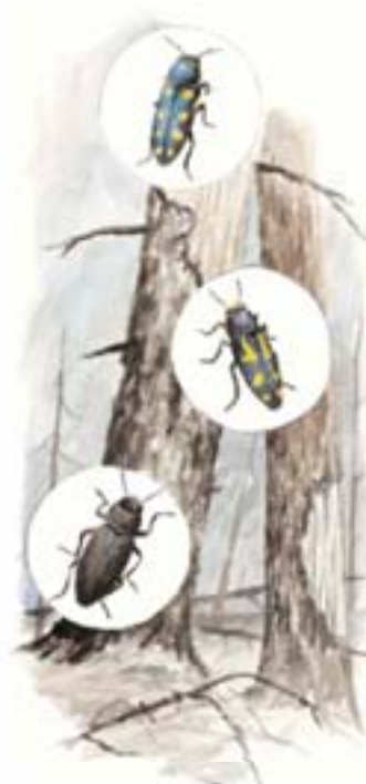
Årstjäktig prälsbagge ( Dipraxis octoguttata ), gulfläckig prälsbagge ( Dipraxis novemmaculata ) och sotsvart prälsbagge ( Melanophila acuminata ) är tre arter som kan dyka upp efter en brand.

Bränningstillfället kommer att bestämmas med kort varsel beroende på väderläget. Information kommer att gå ut via lokalradion på bränningsdagen.