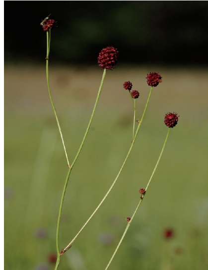
Figur 2. blodtopp, Sangisorba officinalis

Blodtoppblomvecklaren är intimt bunden till sin enda värdväxt blodtopp (se Figur 2). Blodtoppen förekommer i två former med olika kromosomantal. En form ( 2n=56 ) hittas ofta i ängen och främst i södra delen av utbredningsområdet (Garda-Norrlanda). Den andra ( 2n=28 ) finns ofta i kalkkärr och alvarvåtar och förekommer främst i norra delen av utbredningsområdet (Bäl-Hejnum). De två formerna är dock mycket svåra att skilja i fält och om skillnaderna dem emellan har någon betydelse för blodtoppblomvecklaren är inte undersökt. Blodtoppen blommar i juli-augusti, ängsformen tidigare än kalkkärrsformen.