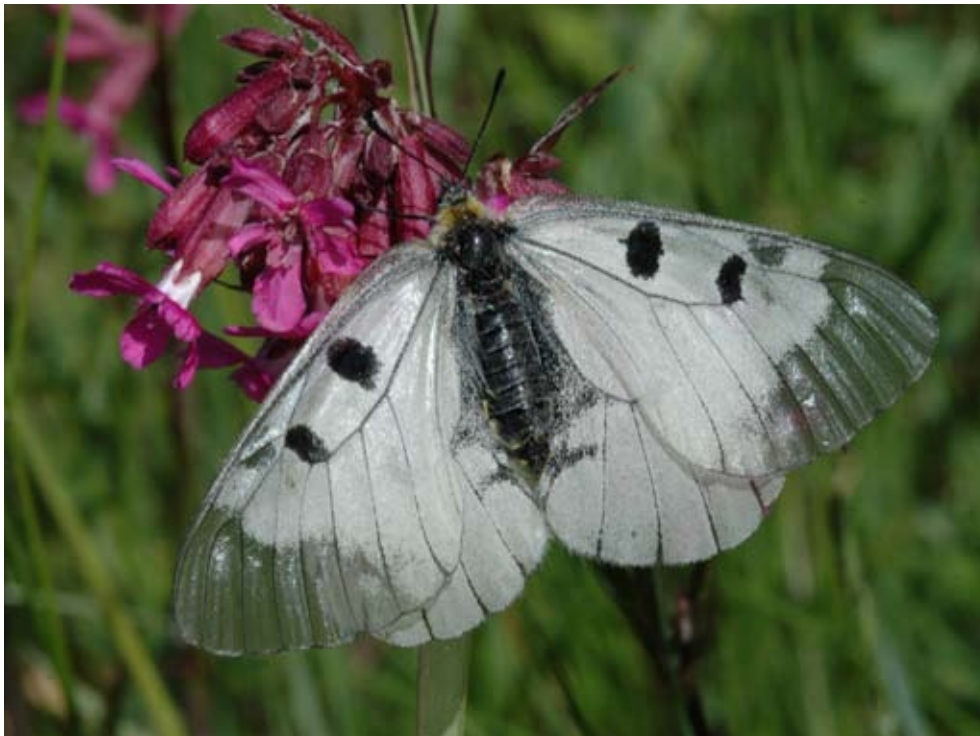
Figur 4. Mnemosynefjäril på nektargivande tjärblomster.

För att den fullbildade fjärilen ska kunna täcka sitt energibehov för flykt och äggproduktion är närheten till nektarförande växter viktig. Inga studier har kunnat påvisa betydelsen av enstaka nektarväxter för mnemosyne-fjäril men arten är en flitig blombesökare. De växter som besöks mest frekvent är hundkex, skogsnäva, blodnäva, vanlig smörblomma, tjärblomster, stormhatt, samt skogs- och kråkvicker (Imby 1995, 1996b). Fjärilarnas val av blommor tycks dock till största delen bero på tillgång, men kan sannolikt också vara individuellt eller lokalt betingat.