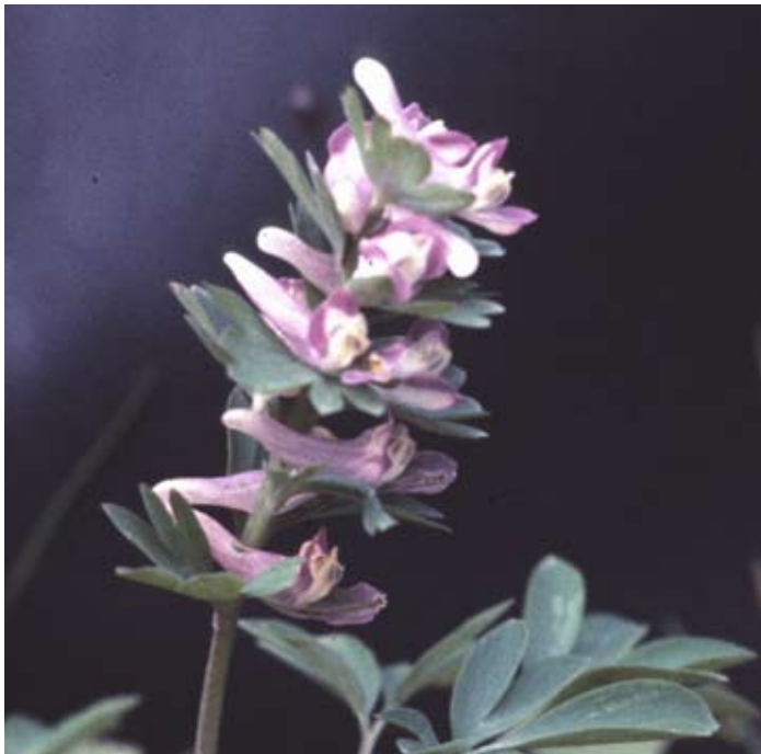
Figur 2. Sloknunneört är en av artens värdväxter

Riklig förekomst av nunneörter är ett absolut krav som arten ställer på sin livsmiljö. Dessa växter trivs i näringsrika jordar, ofta på kalkrik berggrund. På grund av att nunneörterna blommar före eller senast vid lövsprickningen blir de inte bortskuggade under lövträd och buskar. Barrträd som tall och gran skuggar dock bort alla exemplar av nunneört. Nunneört förefaller ha svårt att hävda sig i konkurrensen med andra gräsmarksarter men verkar trivas utmärkt i marker med storväxta hög- och sensommararter som älgört och i Medelpad också stormhatt. Orsaken tycks vara att sådana stora och kraftfulla växter kväver alla eventuella konkurrenter och på så vis lämnar utrymme för nunneörterna att utvecklas på våren. Efter blomningen vissnar nunneörterna ned. En undersökning på tre mnemosynelokaler i Uppland 1986 (Imby 1996a) visade att nunneörter hade en täckningsgrad på 3-4% av lokalens totala yta.