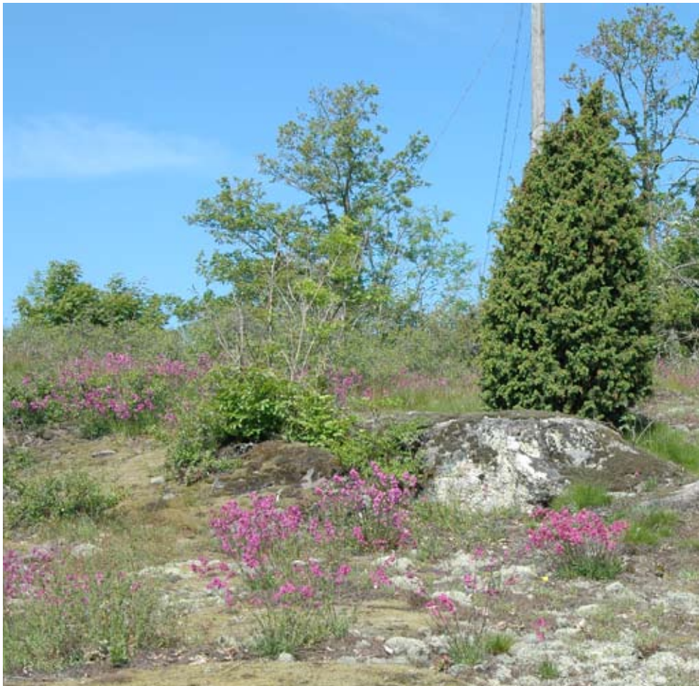
Figur 3. Livsmiljö i Blekinge med gott om tjærblomster.

Fjärilen tycks kräva hög vegetation då den vilar, i synnerhet honan. I flera fall där hög vegetation slagits eller betats har fjärilarna lämnat området och uppsökt närmaste intilliggande orörda gräsmark.