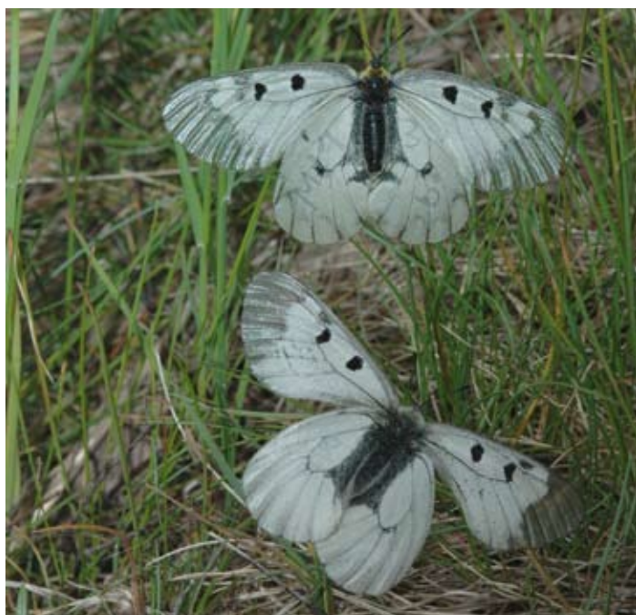
Figur 1. Mnemosynefjäril, hona överst och hane nederst.

Mnemosynefjäril tillhör våra största dagfjärilar och har en vingbredd på mellan 55 och 65 mm. Fjärilen uppfattas som vit och flykten är elegant och innehåller typiska glidmoment och rörelser som gör den lätt igenkännbar även på relativt långa avstånd. Alla individer har tydliga svarta ribbor och två svartgryniga fläckar på varje vinge. Vingformen är den typiska för apollofjärilar med rundade vingar och insvängd innerkant på bakvingen (särdrag för familjen Papilionidae - Riddarfjärilar). Antennerna är korta. Hanens kropp är vithårig medan honans kropp är gleshårig och mörk. Honans svarta kropp syns tydligare och är dessutom försedd med en gulaktig, mer eller mindre tydlig längslinje. Honans vingar är mer transparenta, vanligtvis något mörkare och lätt fettglänsande jämfört med hanens.